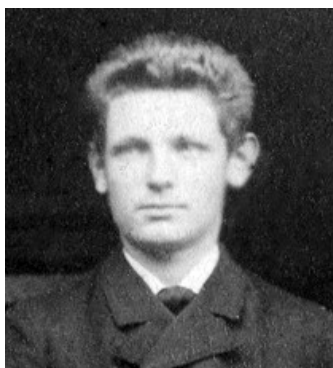
Retoucheret udsnit (UKP/2014-06-19)

[billedet findes på soranerarkivet.dk/biografi/images/6/63/Klassebillede_%28S1886%29.jpg ]